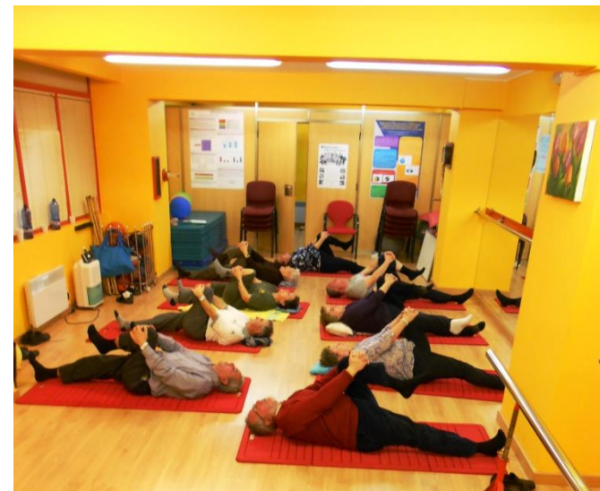
Taller de Estiramientos y Relajación