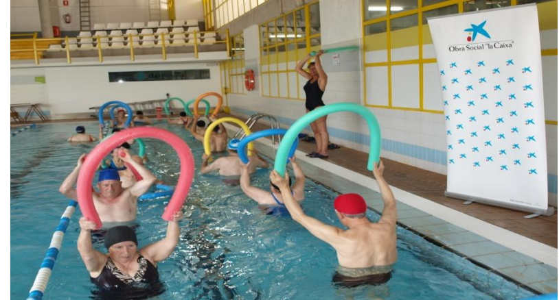
Fisioterapia en Piscina