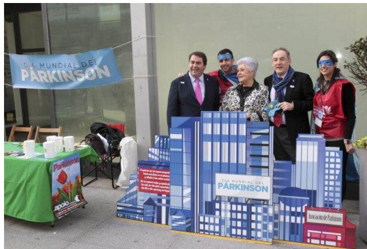
Día Mundial de Parkinson 2014