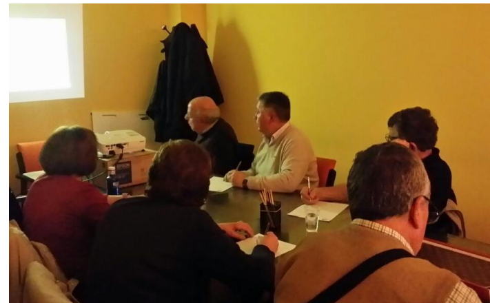
Taller de Estimulación Cognitiva