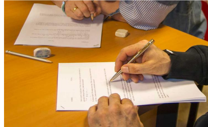
Taller de Escritura