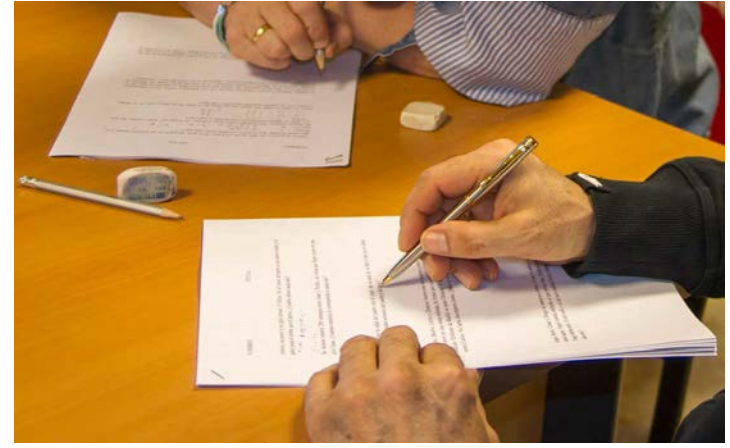
Taller de Escritura