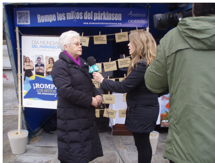
Día Mundial de Parkinson 2013