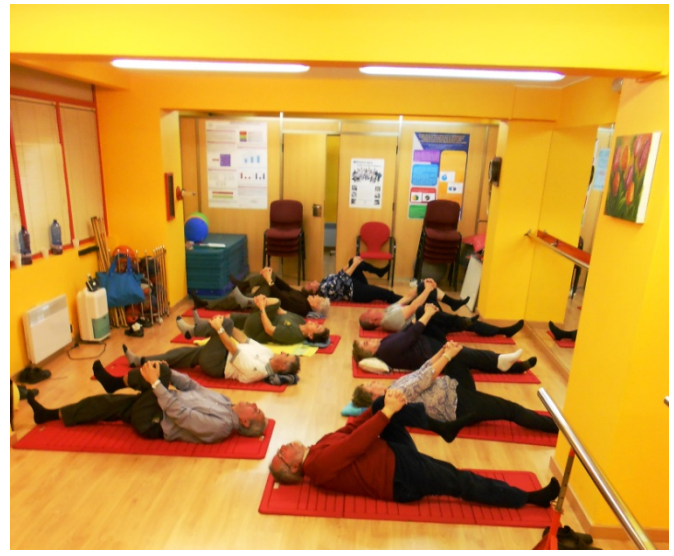
Taller de Estiramientos y Relajación