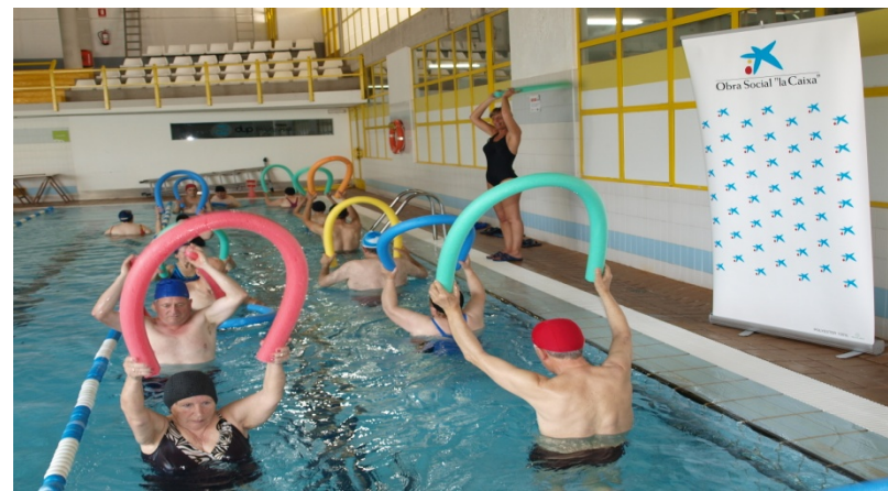
Fisioterapia en Piscina