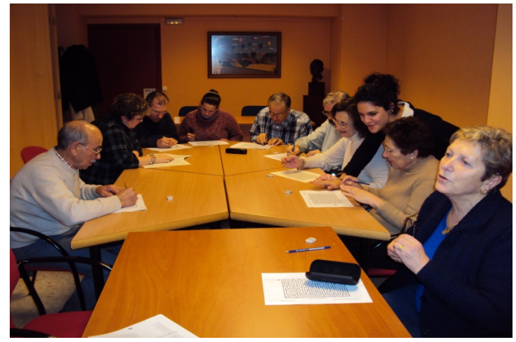
Taller de Estimulación Cognitiva